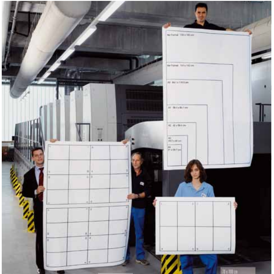
■ Beeindruckend viele Nutzen können auf der ROLAND-900 XXL produziert werden.

Trotzdem ist das grosse Format attraktiv und bietet zumindest auf dem Papier betriebswirtschaftliche Vorteile. Es bleibt abzuwarten, ob die XL- und XXL-Maschinen aus der Nische der Verpacker und Plakatdrucker ausbrechen. Das ist eher unwahrscheinlich, doch wie oft hat man sich bei Prognosen schon getäuscht?